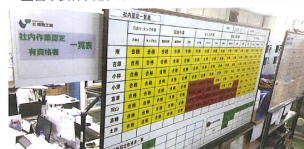
▲社内認定制度を設け、品質レベル向上と均一化に取り組んでいます。