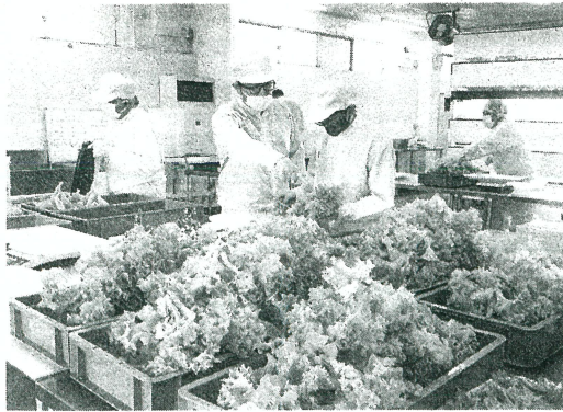
植物工場では障害者の働く場所を毎年提供する(20年12月、群馬県高崎市)

群馬県高崎市のNPO法人、Social House(ソーシャルハウス)は植物工場で作るレタスなどの野菜を増産する。半導体加工などを手掛ける成電工業(高崎市)のグループ団体で、2021年3月に県内で2棟目となる植物工場を稼働させる。植物工場は赤字の事業者も多いなか、「農福連携」で事業拡大を図る考えだ。